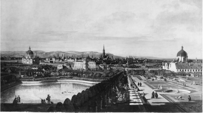
Bernardo Bellotto, Wien, vom Belvedere aus gesehen (1758/61)