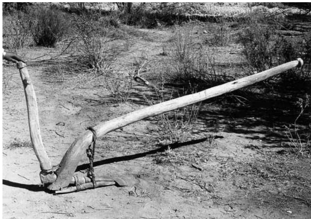
Abb. 9: Arl „saheb“-Typus mit Streichbrett