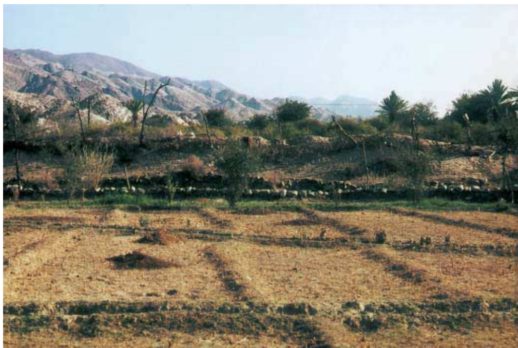
Abb. 5: Kästchenfelder bei Baḥwān