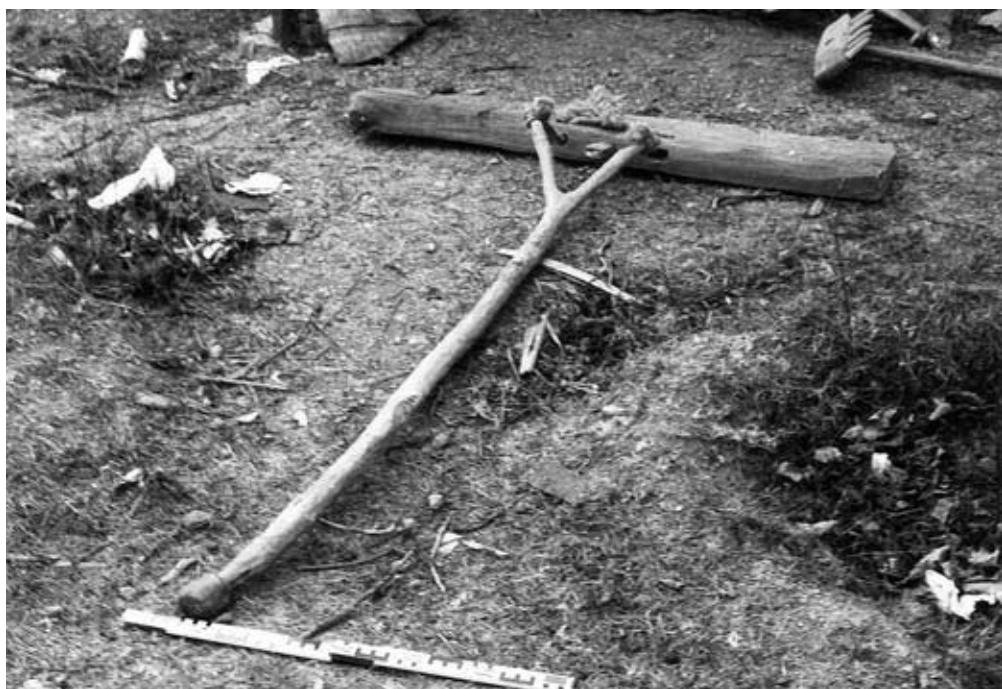
Abb. 20: Ackerschlepe