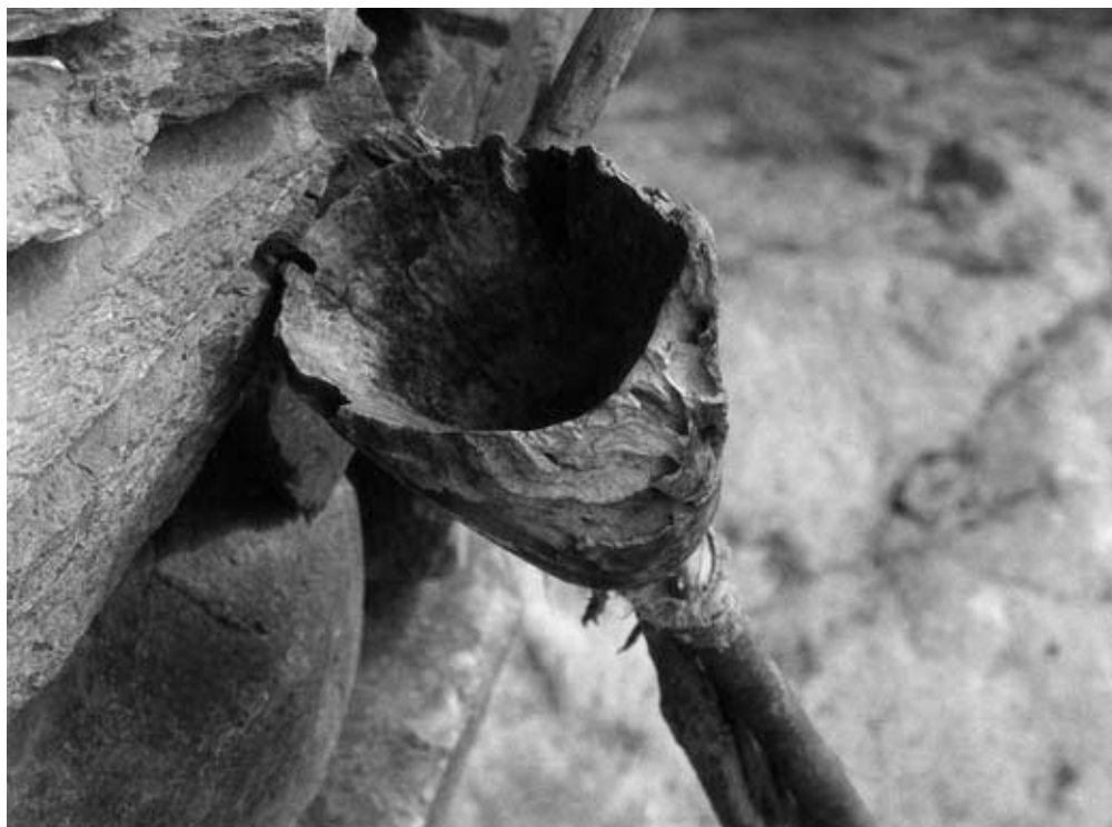
Abb. 12: Saattrichter (verholzter) Kürbis mit Rohr