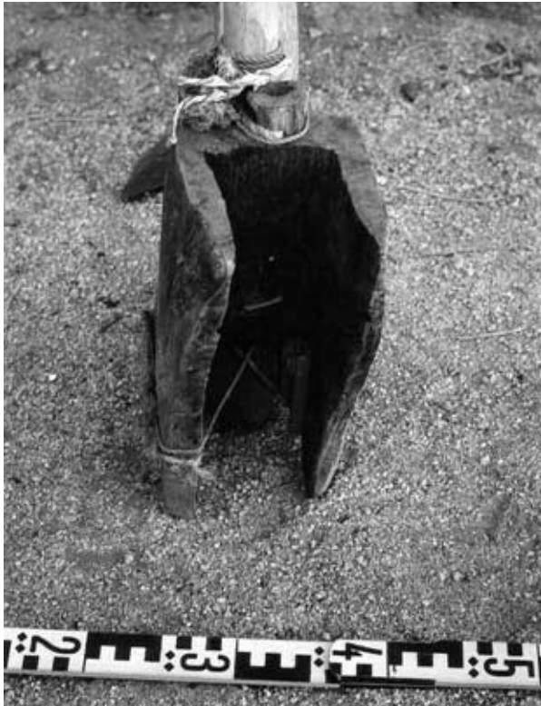
Abb. 14: Innenansicht von Abb. 13