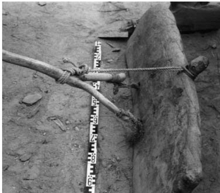
Abb. 19: Gespanngezo- genes Erdstreichbrett