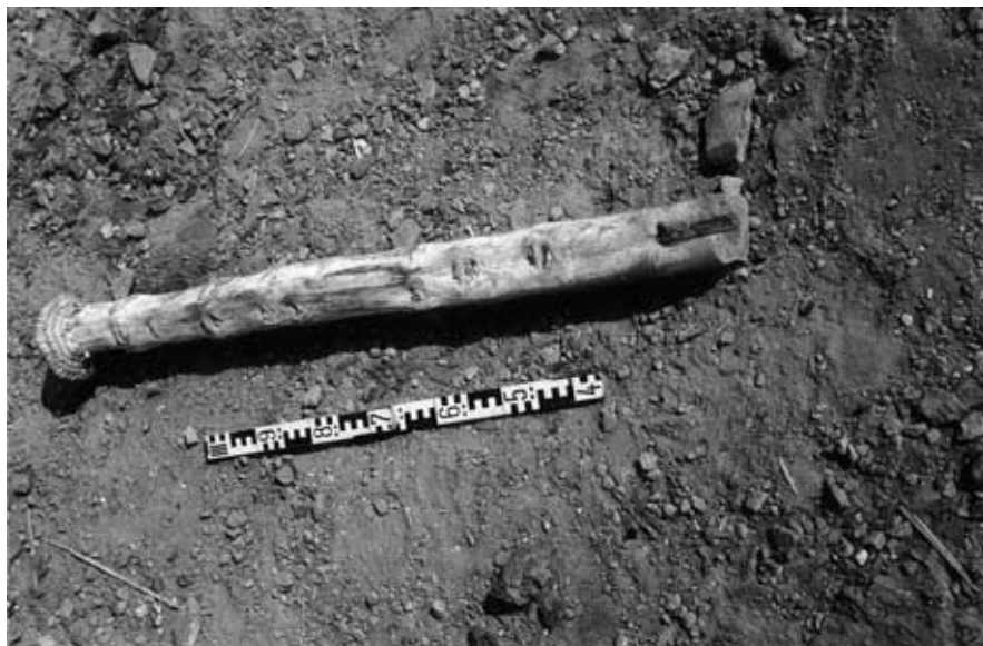
Abb. 11: Saattrichter (geflochten) mit Rohr