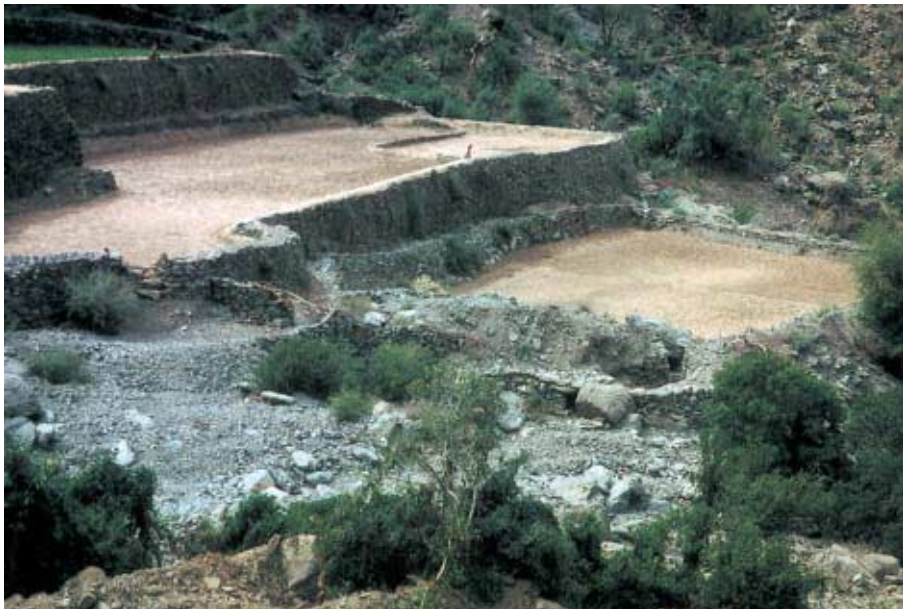
Abb. 7: Feldterrassen-Anlage