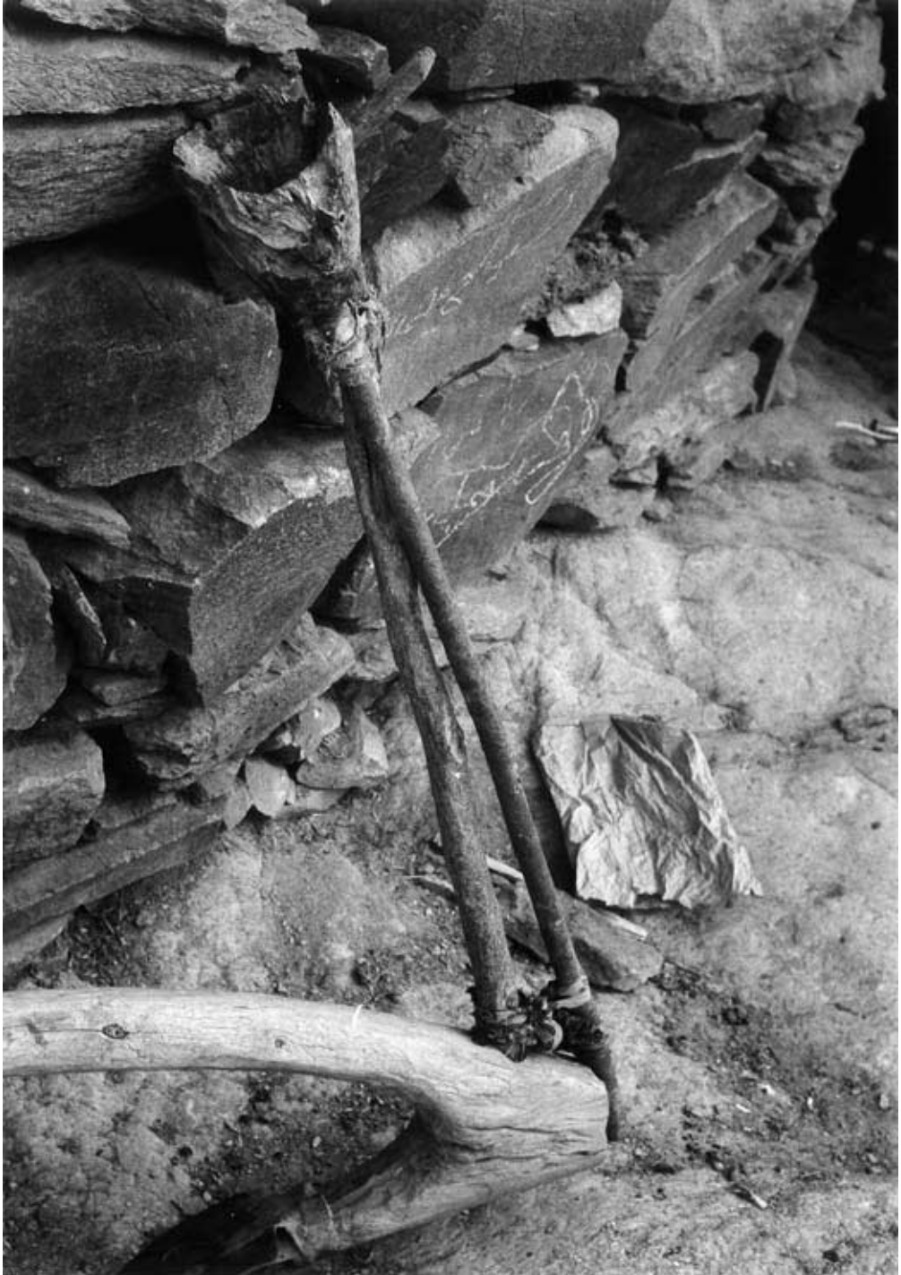
Abb. 10: Arl mit Saattrichter