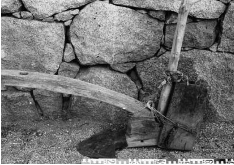
Abb. 13: Arl mit kastenartigen Behälter für Saatrichter