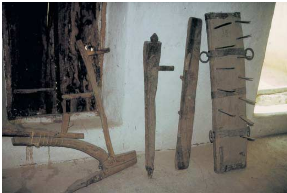
Abb. 15: Sohlenlose Arl mit Sävorrichtung