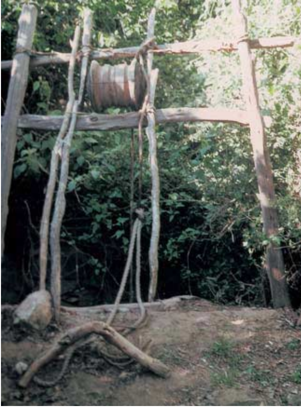
Abb. 21: Brunnengerüst