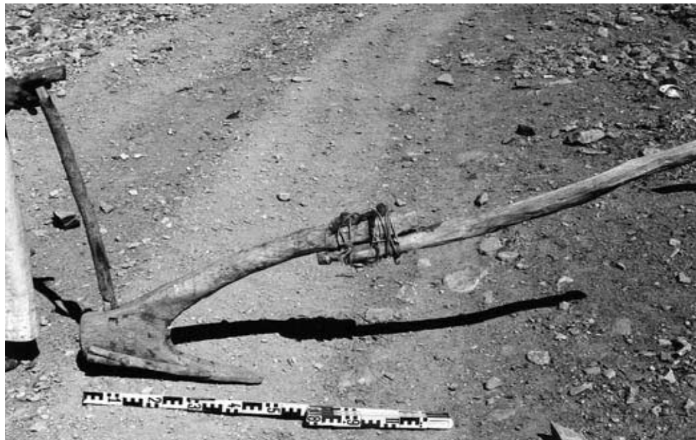
Abb. 8: Zusammengesetzte Arl mit Streichflügel