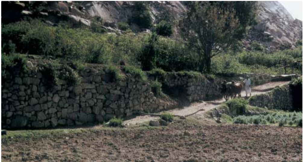
Abb. 22: Zu Abb. 21 zugehörige Zugbahn