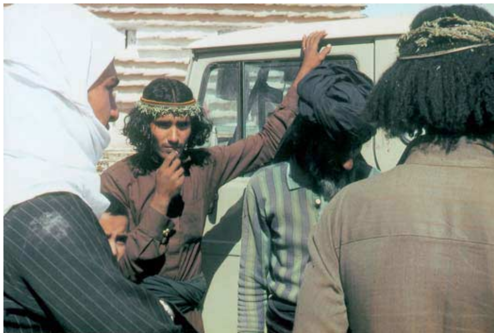
Abb. 2: Männer der Rijāl al-Mā‘-Konföderation