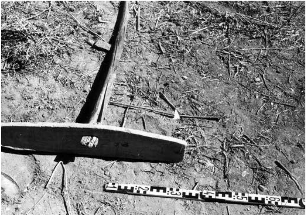
Abb. 18: Handgezogenes Erdstreichbrett