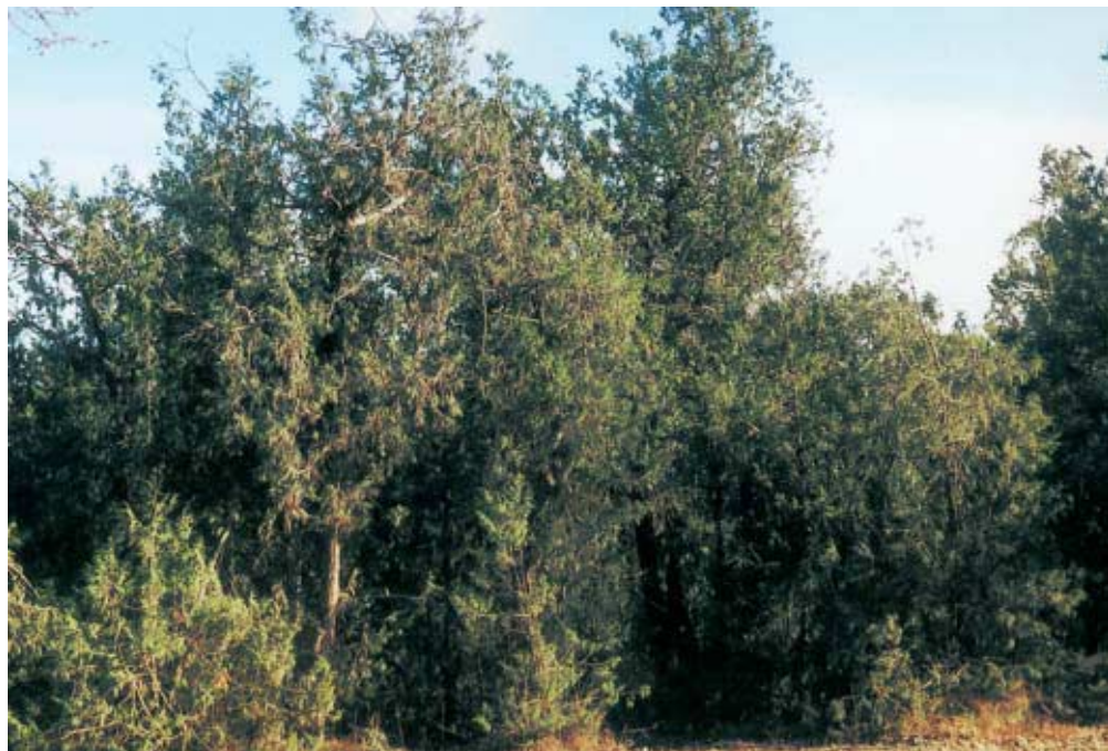
Abb. 4: Wacholder-Wald in der Umgebung von al-Bāḥa