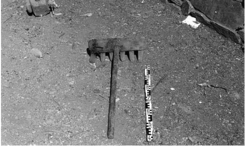
Abb. 17: Balkenrechen