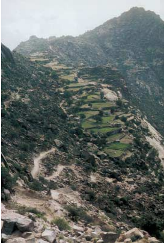
Abb. 6: Landschaft im südlichen Hijāz mit Terrassenfeldern