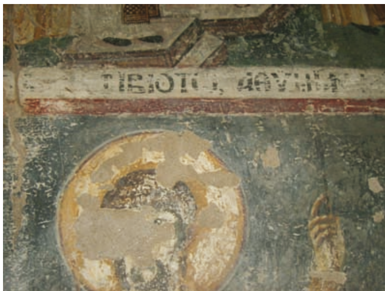
XXXV Thessalonike, Kirche Hagios Demetrios, Parekklesion Hagios Euthymios, Stifterepigramm (Nr. 112)