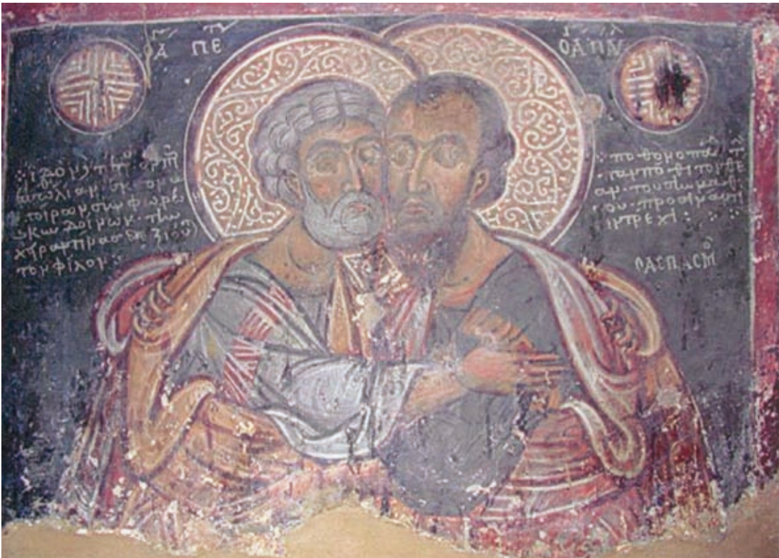
XL Ano Dibre, Kirche Hagia Triada, Epigramm neben Petrus u. Paulus (Nr. 125)