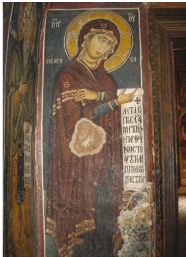
LV Nikitari, Kirche Panagia Asinou, Narthex, Epigramm auf der Schriftrolle der Theotokos (Nr. 234)