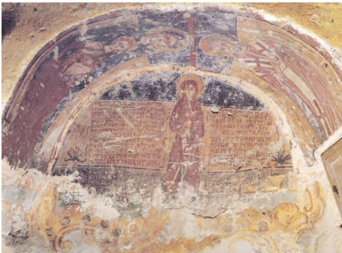
XLVI Carpignano Salentino, Kirche Santa Marina e Cristina, zwei Grabepigramme im nordwestlichen Bereich der Krypta (Nr. 186–187)