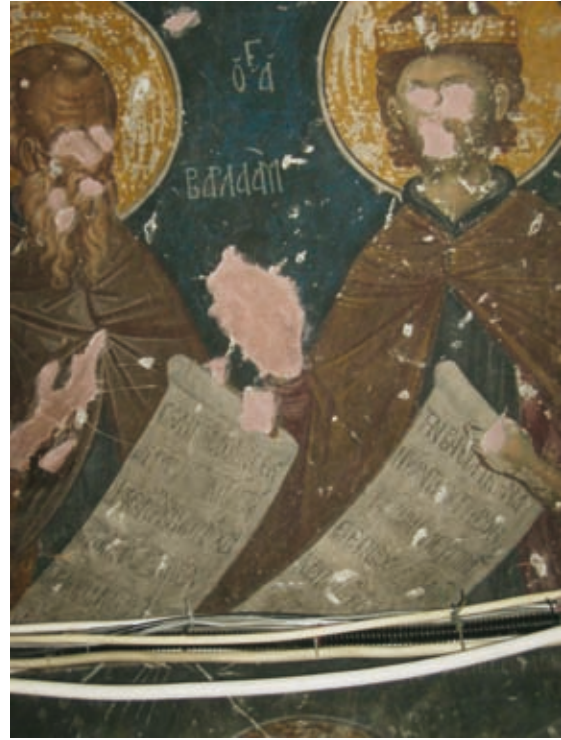
XXXIX Thessalonike, Kirche Prophetes Elias, Wölbung des südlichen Eingangs in den Narthex, Epigramme auf den Schriftrollen von Barlaam u. Ioasaph (Nr. 119–120)