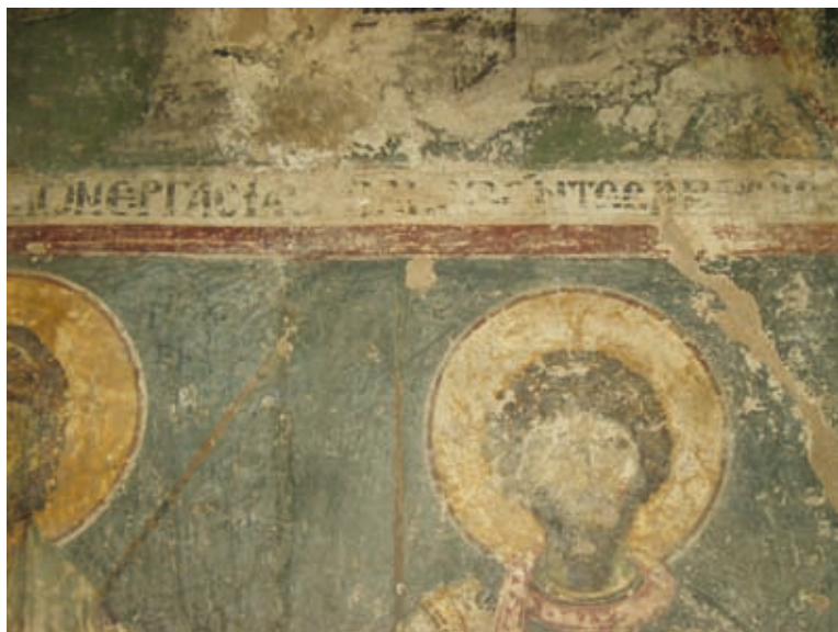
XXXIV Thessalonike, Kirche Hagios Demetrios, Parekklesion Hagios Euthymios, Stifterepigramm (Nr. 112)