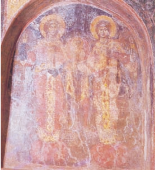
XXI Geraki, Kirche Hagios Ioannes Chrysostomos, nordöstliche (blinde) Apsis, Epigramm zwischen den Erzengeln Gabriel u. Michael (Nr. 131)