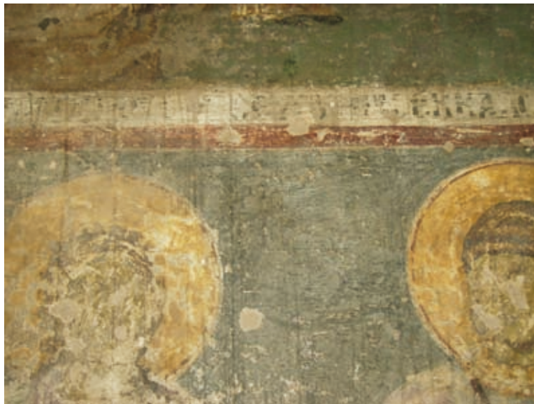
XXXIII Thessalonike, Kirche Hagios Demetrios, Parekklesion Hagios Euthymios, Stifterepigramm (Nr. 112)