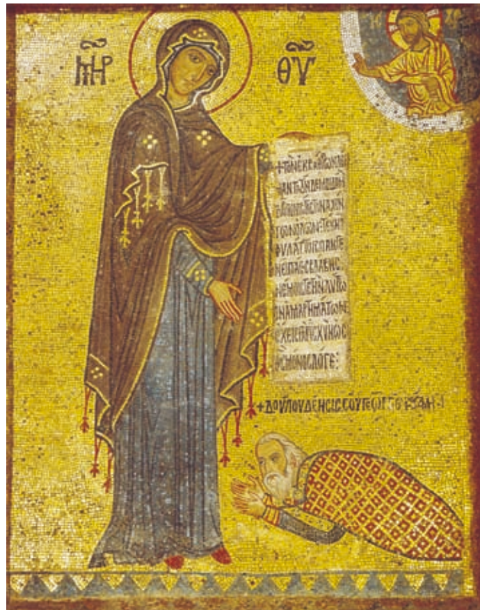
LXII Palermo, Kirche Santa Maria dell' Ammiraglio, nördliches Seitenschiff, Epigramm auf der Schriftrolle der Theotokos (Nr. M5)