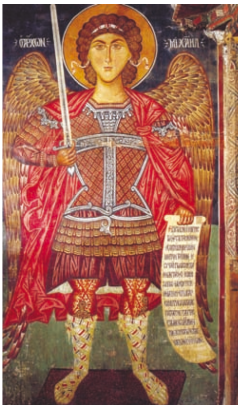
LVII Pedoulas, Kirche Archangelos Michael, Nordwand des Naos, Epigramm auf der Schriftrolle des Erzengels Michael (Nr. 249)