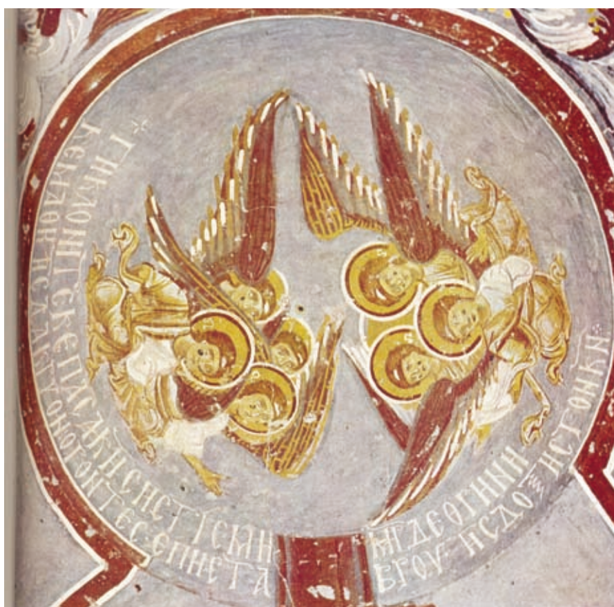
XLVII Korama, Kapelle 19 (Elmalı Kilise), Epigramm im Kuppelbereich (Nr. 193)