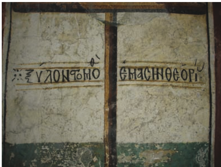
LIII Lagoudera, Kirche Panagia tou Arakos, Vers in der Laibung der Südtür (Nr. 229)