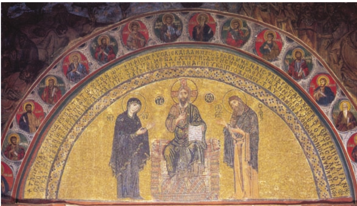
LX Athos, Katholikon des Klosters Vatopedi, Exonarthex, Epigramm in der Portallinette (Nr. M1)