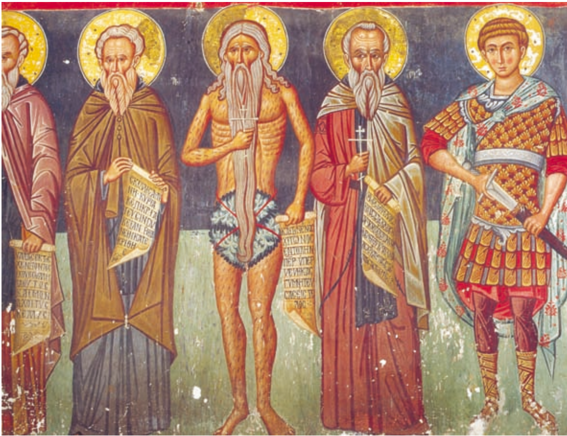
LIX Platanistasa, Timios Stauros tou Hagiasmati, Südwand, Epigramm auf der Schriftrolle des hl. Antonios (Nr. 256)