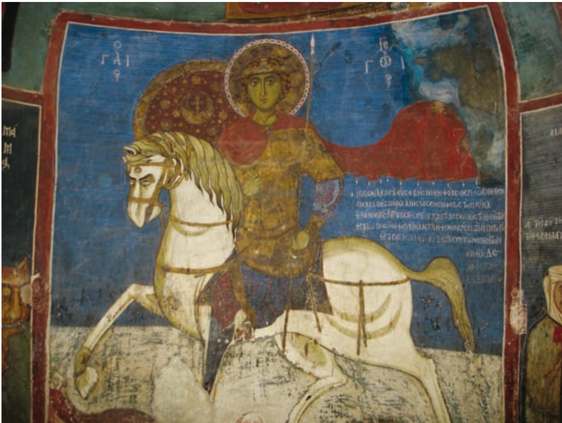
LIV Nikitari, Kirche Panagia Asinou, Epigramm in der südlichen Apsis des Narthex (Nr. 232)