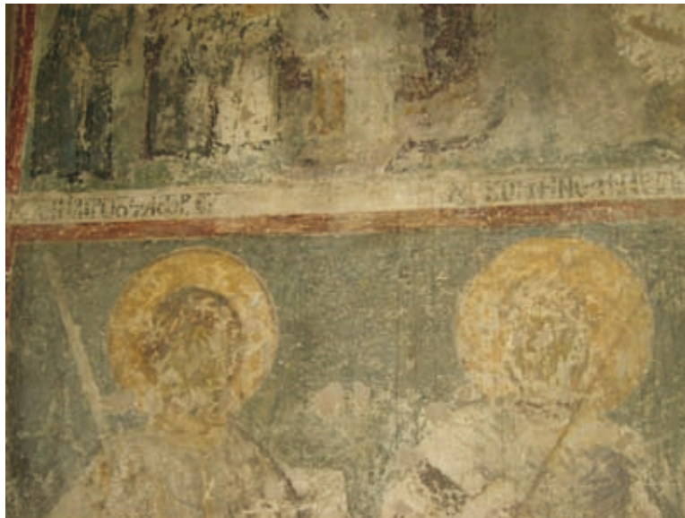
XXXII Thessalonike, Kirche Hagios Demetrios, Parekklesion Hagios Euthymios, Stifterepigramm (Nr. 112)