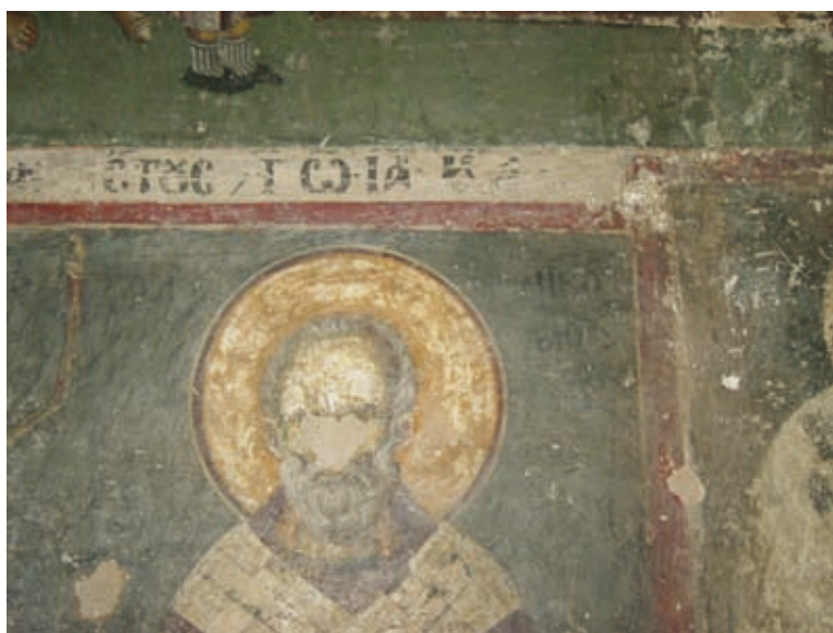
XXXVII Thessalonike, Kirche Hagios Demetrios, Parekklesion Hagios Euthymios, Stifterepigramm (Nr. 112)