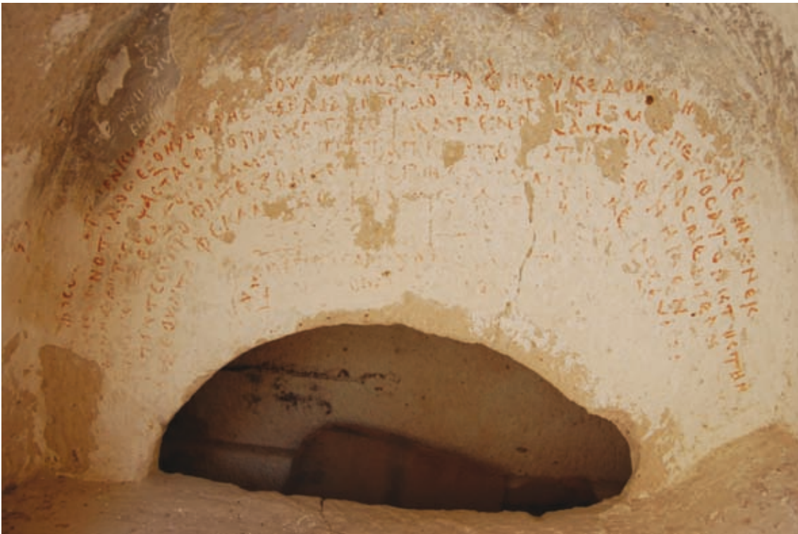
XLVIII Zelve, Einsiedelei des Mönches Symeon, Kapelle, Narthex, Epigramm im Arkosolium der Nordwand (Nr. 210)