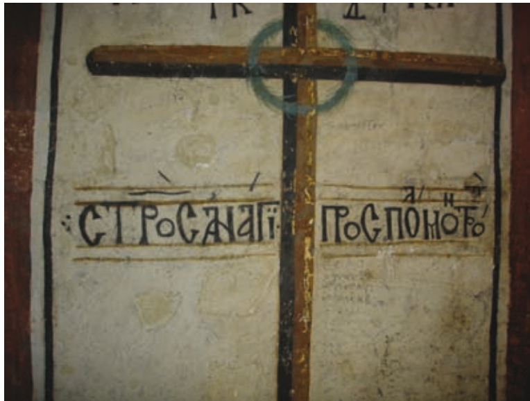
LI Lagoudera, Kirche Panagia tou Arakos, Vers in der Laibung der Nordtür (Nr. 227)