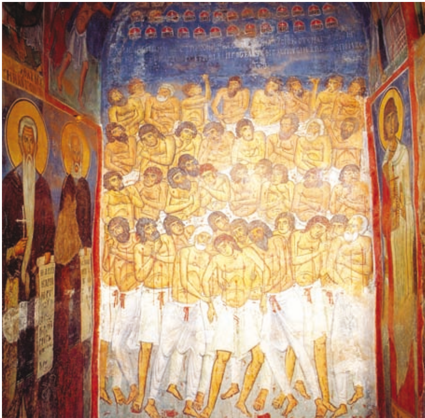
LVI Nikitari, Kirche Panagia Asinou, nordwestliche Nische des Naos, Epigramm oberhalb der Darstellung der 40 Märtyrer von Sebaste (Nr. 237)