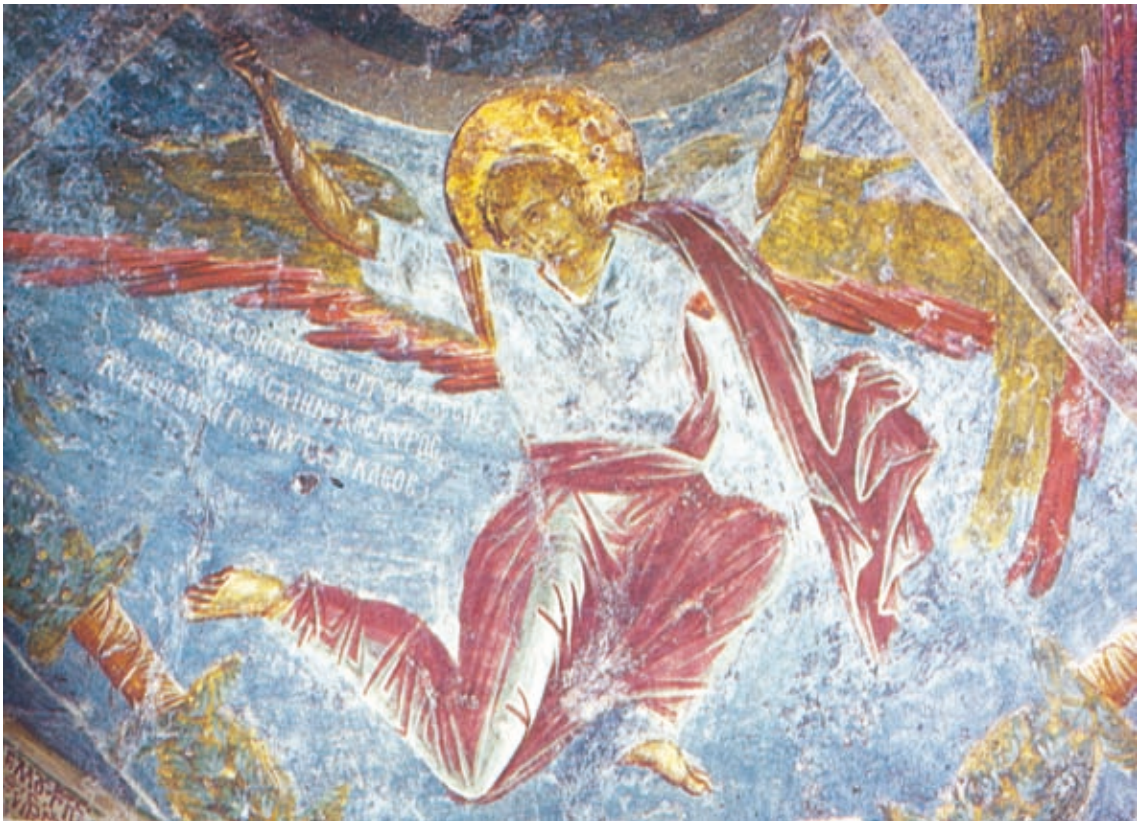
XLIV Mistra, Kirche Maria Hodegetria, Südwestkapelle, Epigramm in der nordöstl. Ecke (Nr. 149)