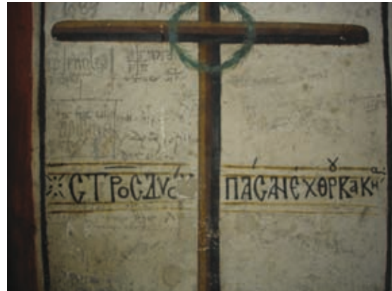
L Lagoudera, Kirche Panagia tou Arakos, Vers in der Laibung der Nordtür (Nr. 226)