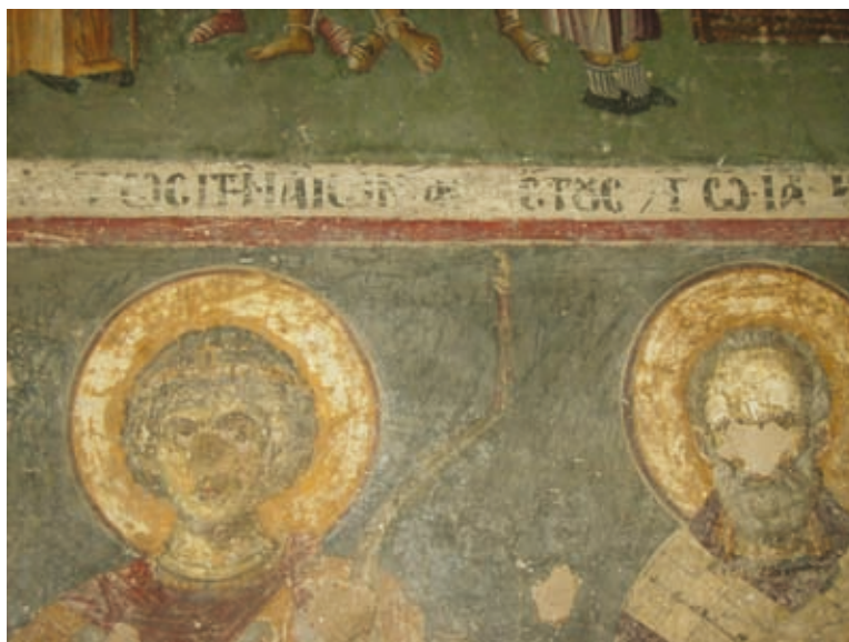
XXXVI Thessalonike, Kirche Hagios Demetrios, Parekklesion Hagios Euthymios, Stifterepigramm (Nr. 112)