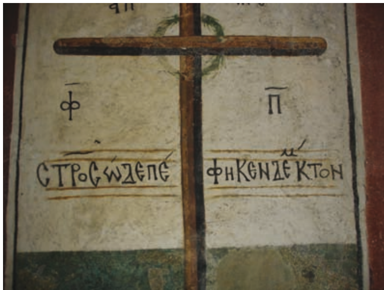
LII Lagoudera, Kirche Panagia tou Arakos, Vers in der Laibung der Südtür (Nr. 228)