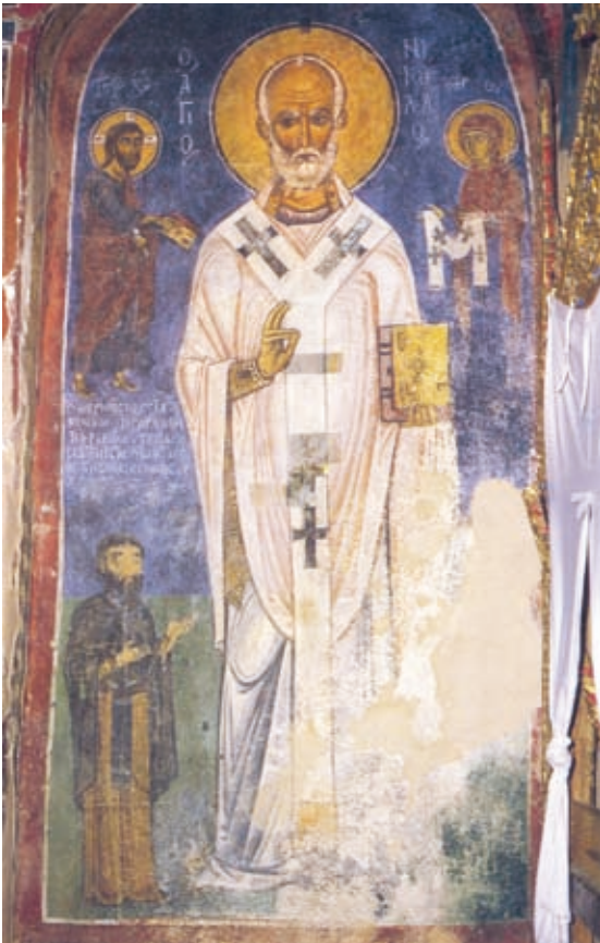
XLIX Kakopetria, Kirche Hagios Nikolaos tes steges, Durchgang zum Diakonikon, Inschrift neben dem hl. Nikolaos (Nr. 221)