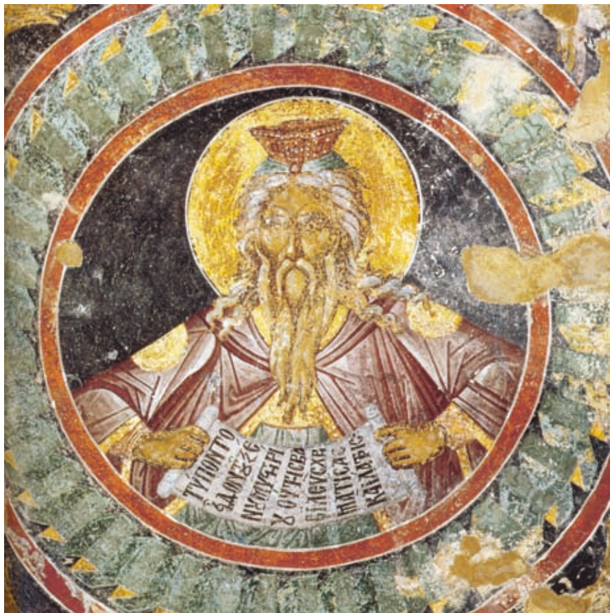
XLV Mistra, Kirche Maria Pantanassa, Flachkuppel der Südepore, Epigramm auf der Schriftrolle von Melchisedek (Nr. 153)