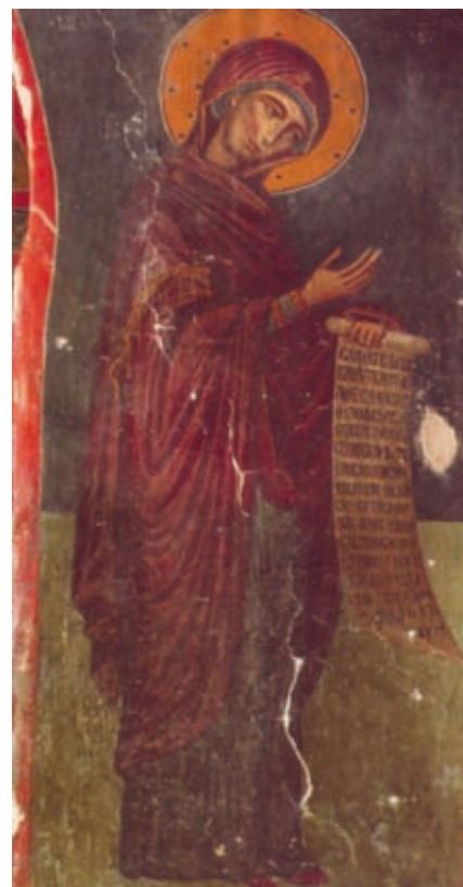
LVIII Platanistasa, Timios Stauros tou Hagiasmati, Nordwand, Epigramm auf der Schriftrolle der Theotokos (Nr. 252)