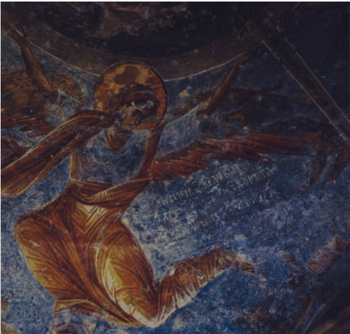
XXIII Mistra, Kirche Maria Hodegetria, Südwestkapelle, Epigramm in der südöstl. Ecke (Nr. 147)