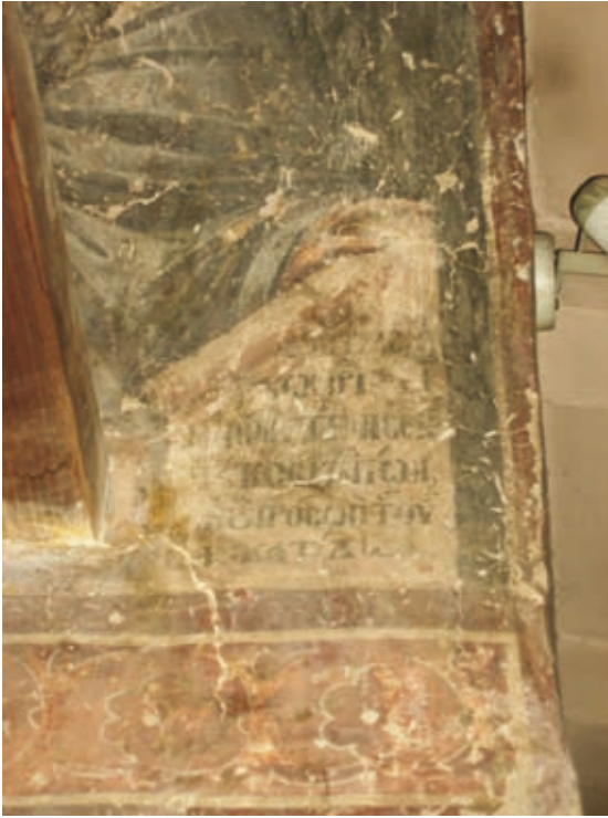
XXXVIII Thessalonike, Kirche Hagios Demetrios, Parekklesion Hagios Euthymios, Epigramm auf der Schriftrolle des hl. Stephanos des Jüngeren (Nr. 113)