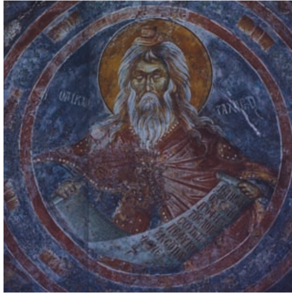
XXII Mistra, Kirche Maria Hodegetria, Flachkuppel in der Frauenempore, Epigramm auf der Schriftrolle von Zacharias (Nr. 146)