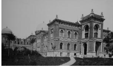
Abb. 1: Die Wiener Universitätssternwarte im frühen 20. Jahrhundert.