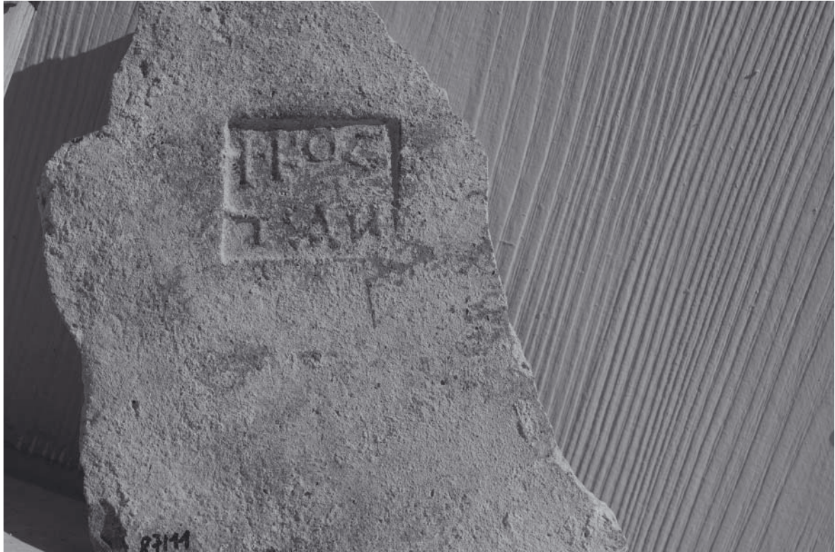
Abb. 5: Ziegelstempel (Ko(n)stantinos)