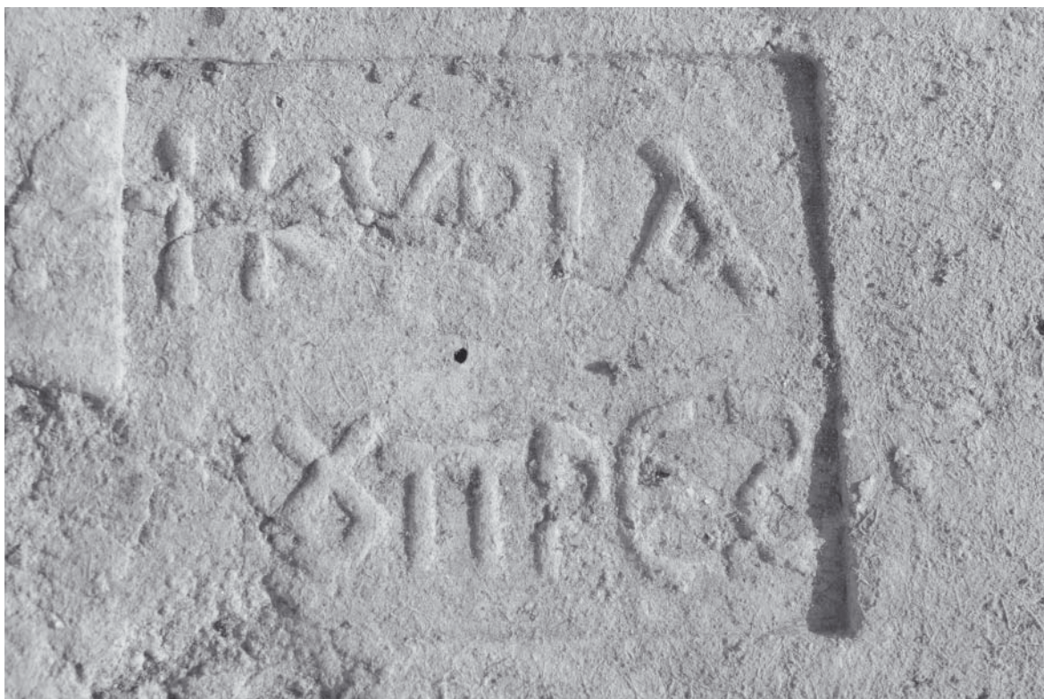
Abb. 8: Ziegelstempel (Kyriakos)