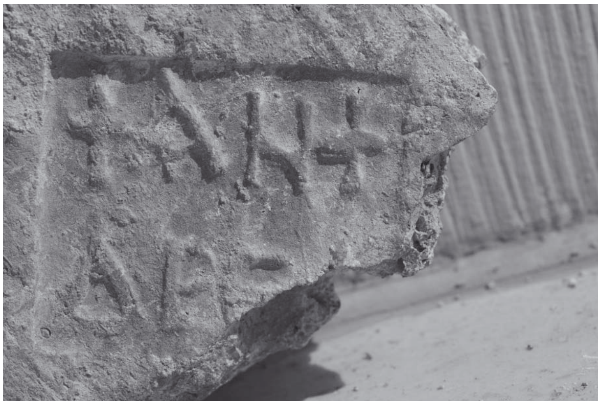
Abb. 4: Ziegelstempel (Andreas)