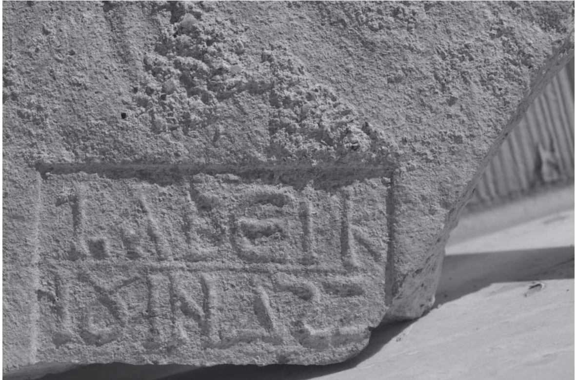
Abb. 1: Ziegelstempel (Aberkios)