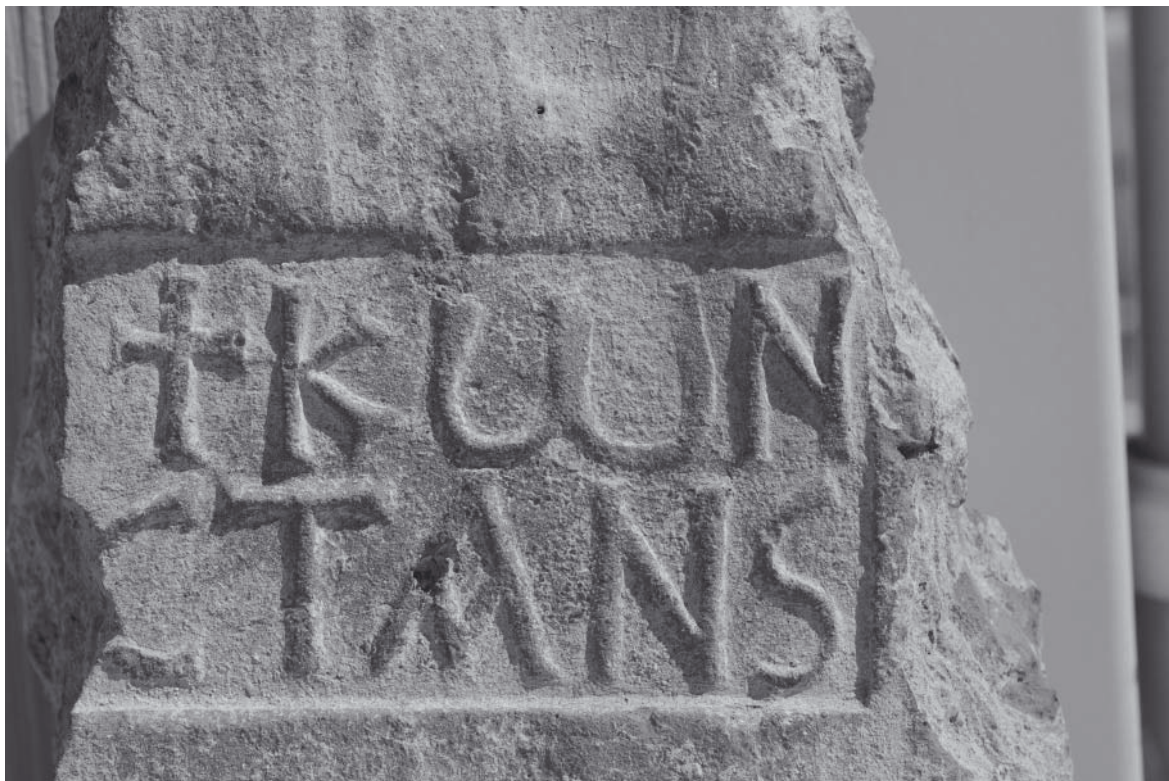
Abb. 7: Ziegelstempel (Konstans)