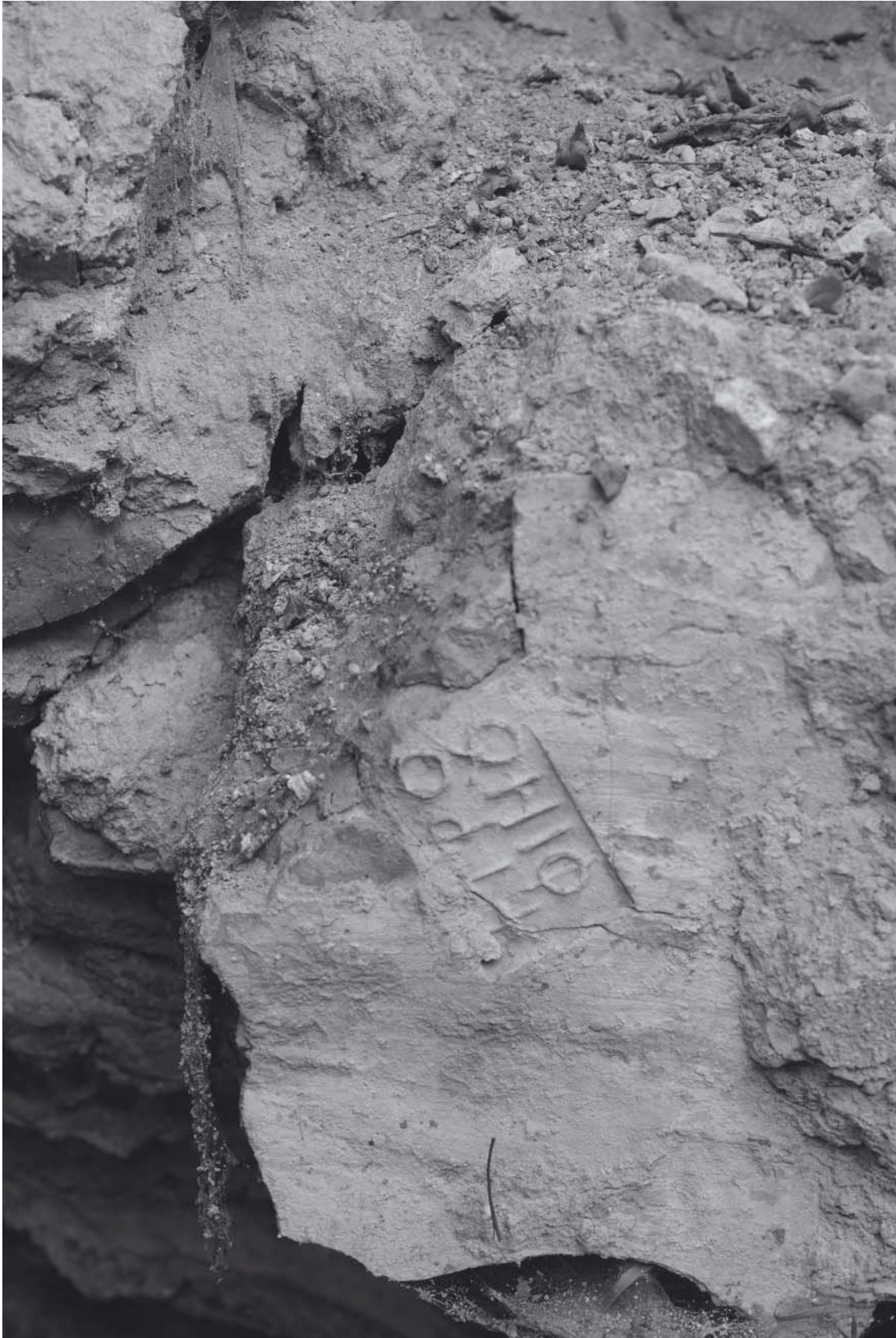
Abb. 9: Ziegelstempel (Trophimos)