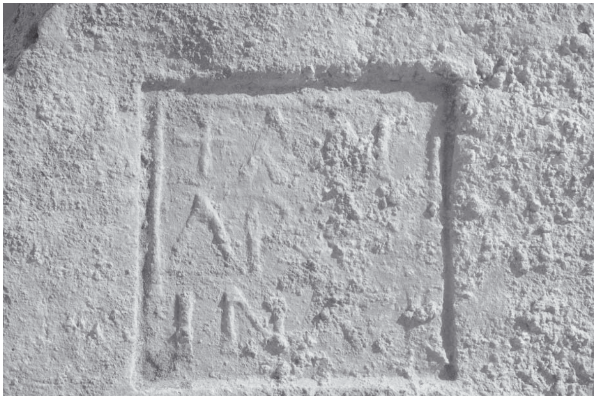
Abb. 3: Ziegelstempel (Andreas)