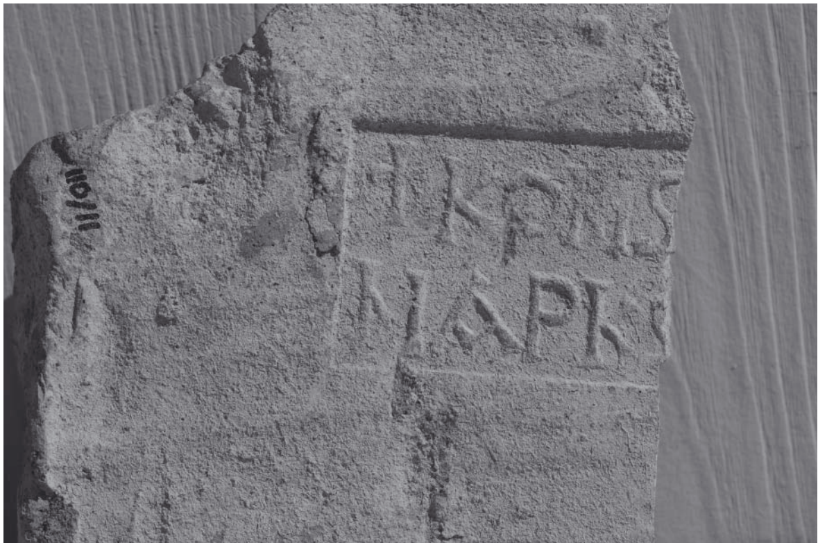
Abb. 6: Ziegelstempel (Konstantinos)