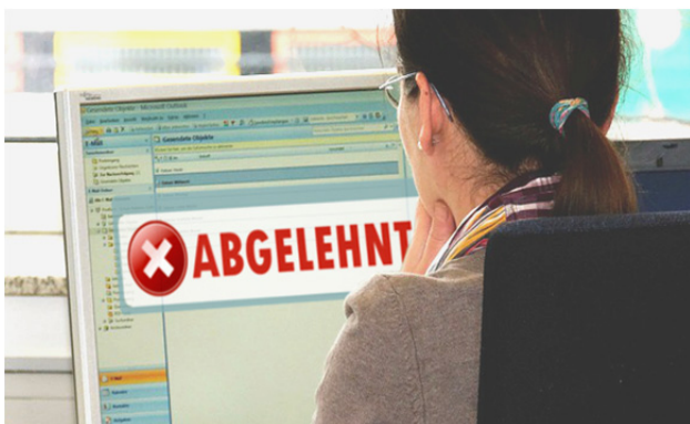
Bei der Kreditvergabe: Der Computer sagt „Nein“

Der verständliche Wunsch, das Risiko eines Zahlungsausfalls zu verringern, führt oft dazu, dass sich Banken mehrfach auf Kosten der KonsumentInnen absichern: bei einer Kreditvergabe wird nicht nur der Credit Score berechnet, sondern auch eine Lebensversicherung verpfändet und oft eine Versicherung abgeschlossen, die in Zeiten ohne regelmäßiges Einkommen die Zahlung der Raten übernimmt. Und das, obwohl das unternehmerische Risiko der Bank auch durch die Zahlung der Zinsen mit abgegolten wird.