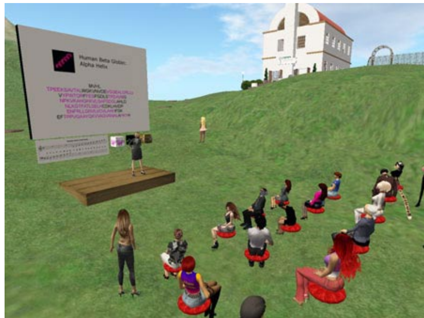
Abbildung 2-4: Lehrveranstaltung in Second Life

Auch die Webseiten Simteach 13 und die Annotated Bibliography of Second Life Educational Online Resources 14 widmen sich ausführlich der Lehre in Second Life.