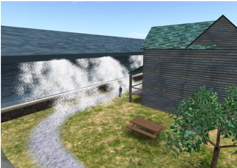
Abbildung 2-3: Simulation eines Tsunamis auf der Insel der NOAA