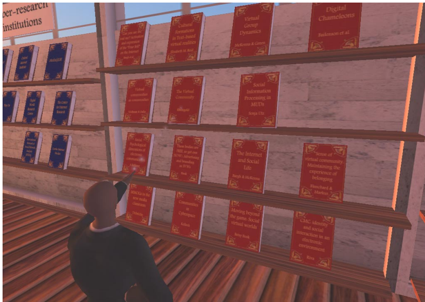
Abbildung 3-1: Virtuelle Bibliothek im Social Simulation Research Lab

Dagegen besteht durchaus Bedarf für eine Umgebung, die das kollaborative Arbeiten an 3D-Objekten erlaubt (vgl. 2.3). Sollten die bisherigen technischen Grenzen in diesem Gebiet überwunden oder zumindest erweitert werden, könnte hier möglicherweise ein sinnvoller Anwendungsbereich entstehen.