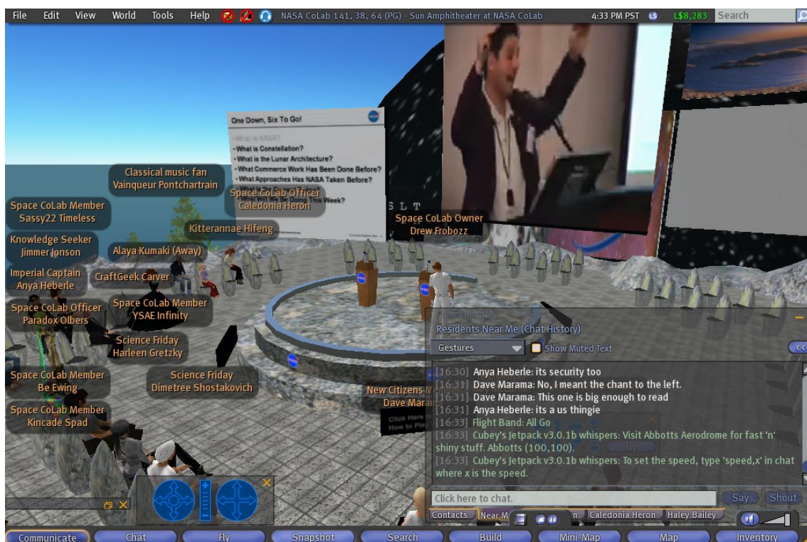
Abbildung 2-5: „Mixed Reality“-Konferenz der NASA

Darüber hinaus lassen sich in Second Life selbstverständlich auch virtuelle Meetings abhalten. Wie bereits oben erwähnt (vgl. 2.1), stellt unter vielen anderen Möglichkeiten z. B. die Zeitschrift Nature entsprechenden Raum für WissenschaftlerInnen zur Verfügung.