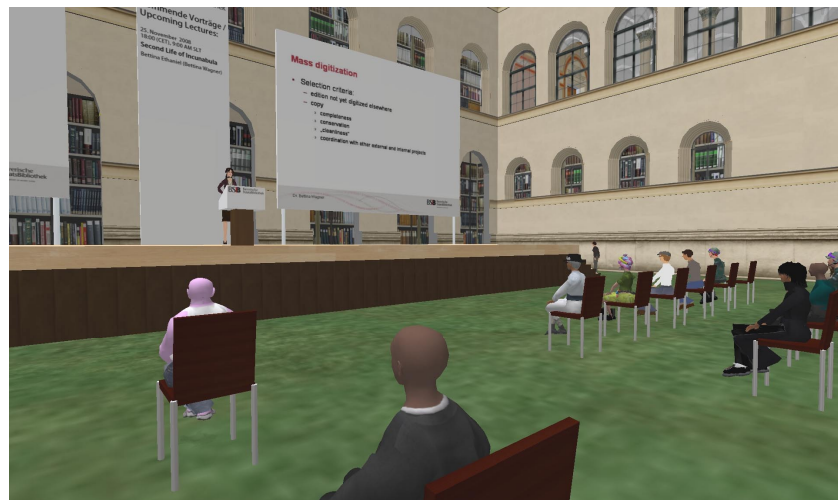
Abbildung 2-6: Vortrag in Second Life am 25.11.2008;