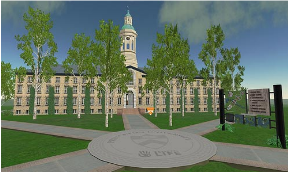
Abbildung 2-1: Repräsentation des Campus der Princeton University in Second Life