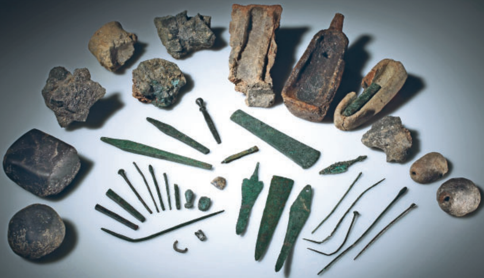
Ensemble metallurgischer Funde vom späthalkolithischen und frühbronzezeitlichen Çukuriçi Höyük: Gussformen, Tiegel, Werkzeuge, Schlacken, Halb- und Fertigprodukte

Die Entwicklung metallurgischer Technologien, die sich bereits ab rund 2900 v. Chr. in einzelnen Produktionszentren, wie dem Çukuriçi Höyük bei Ephesos in der Ostägäis, abzeichnen, wo neben Arsen-Kupfer-Legierungen auch bereits echte Zinnbronzen hergestellt werden. Innerhalb der oben genannten Handels- und Verwaltungszentren erkennen wir zwischen 2700/2600 und 2200 v. Chr. eine deutliche Spezialisierung und Hierarchisierung auch innerhalb der befestigten Anlagen und ihrer Außensiedlungen; das schließt Sonderbauten für besondere Gruppen, wie Megara in Westanatolien oder Korridorhäuser in der Argolis, ein. Die herausgehobene Rolle von mobilen Händlern als Träger von speziellem Wissen und im Ausbau der überregionalen Netzwerke, die von der Ägäis bis zum Indus reichen, ist Gegenstand aktueller Forschungsdiskussionen.