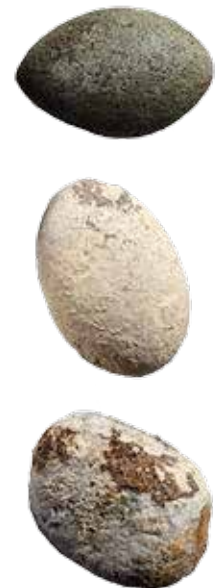
1 Teil des Geschossdepots aus der neolithischen Siedlung des Çukuriçi Höyük, Türkei.